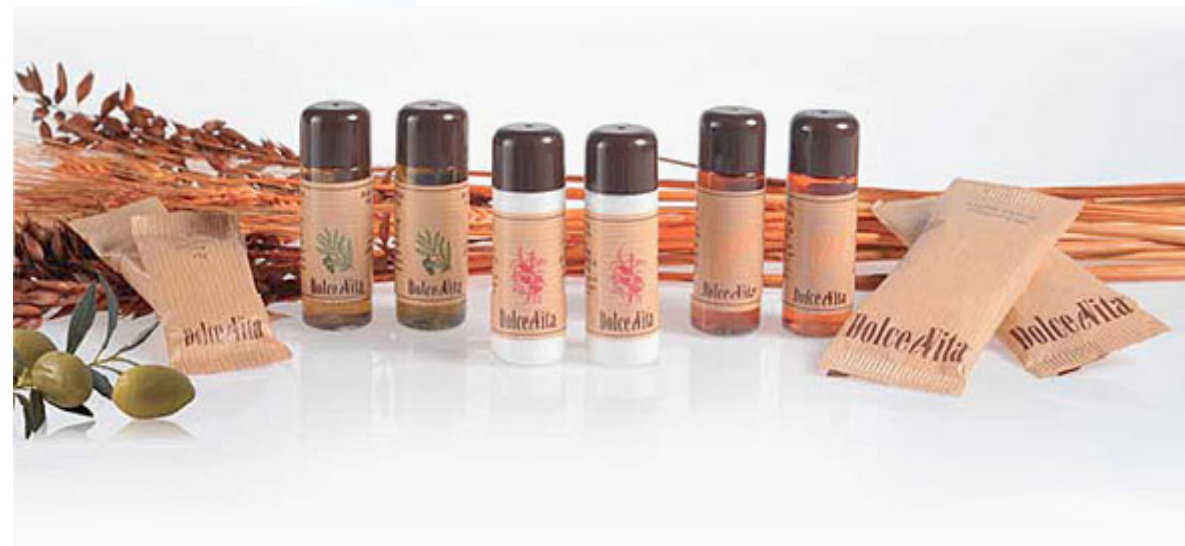
Linea Flacone da 30 ml

Gusto italiano che arricchisce la camera e offre una linea di prodotti particolarmente curata. Profumo aromatico al guaranà per shampoo doccia all'olio di oliva e bagnoschiama all'olio di germe di grano; dolce latte di mandorla per la crema corpo con olio di mandorle dolci; gli accessori sono imbustati in flow pack avana 1000 righe